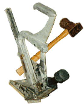
Dụng cụ đóng đinh lát sàn và cái vò.