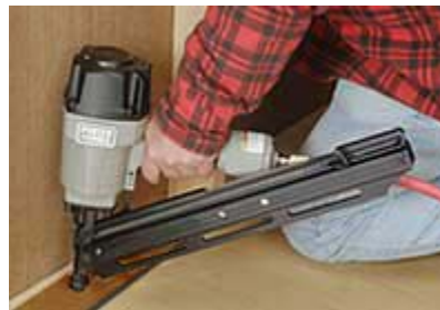
Súng bắn đinh đẩy nhanh quá trình đóng đinh bề mặt.